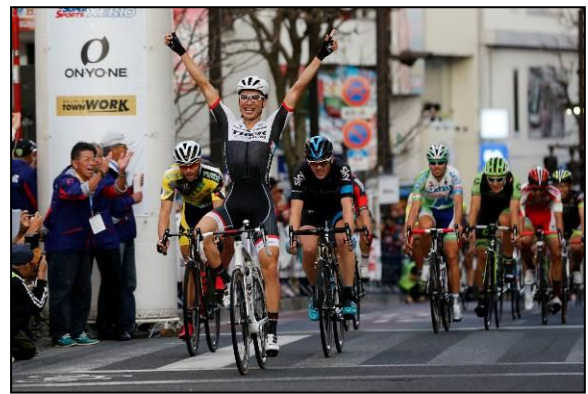
ゴール時の様子(クリテリウム)

10月18日 2015ジャパンカップサイクルロードレース (宇都宮市森林公園/国際レース)