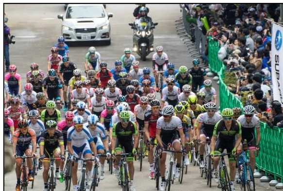
森林公園スタート後の様子 (ロードレース)

10月18日 2015ジャパンカップサイクルロードレース (宇都宮市森林公園/国際レース)