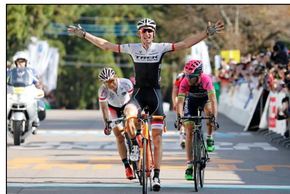
ゴール時の様子(ロードレース)