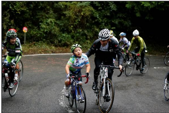
トップ選手と参加者が触れ合う様子(フリーラン)

10月17日 一般愛好家による自転車走行イベント (フリーラン: 宇都宮市森林公園) JCF登録競技者による男女別レース (チャレンジレース, オープンレース: 宇都宮市森林公園) 2015ジャパンカップクリテリウム (宇都宮市市内中心部大通り)