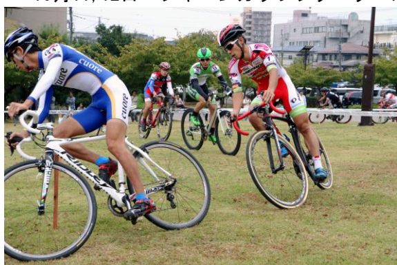
宇都宮城址公園ステージ